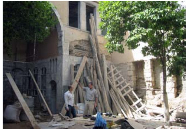
Restauroinnin tilanne huhtikuussa 2008.

Instituutti on toteuttanut kulttuurihistoriallisesti merkittävän restaurointiprojektin suomalaisin varoin. Talon hankinnan rahoitti Alfred Kordelinin säätiö, ja paikallisia perinteitä kunnioittavaan restaurointiin on saatu rahoitusta Suomen Kulttuurirahastolta, Svenska Kulturfondenilta, Helsingin yliopistolta, Åbo Akademien säätiöltä ja Thüringin säätiöltä. Suomalaisten yksityisten säätiöiden mahdollistama omien toimiti-